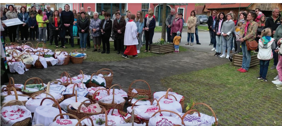
Osterspeisensegung in Weinberg