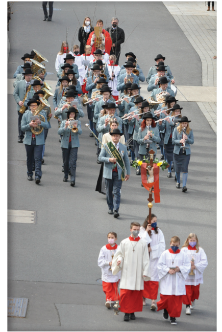
Palmsonntag - Einzug in die Kirche