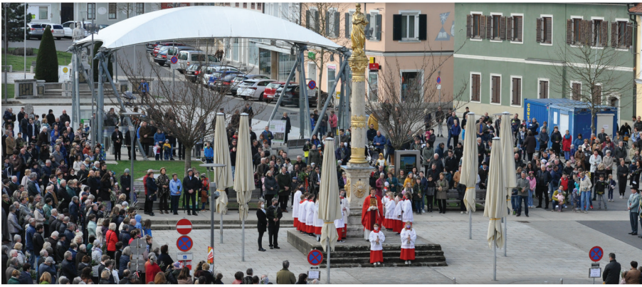
Palmweihe am Hauptplatz Fehring