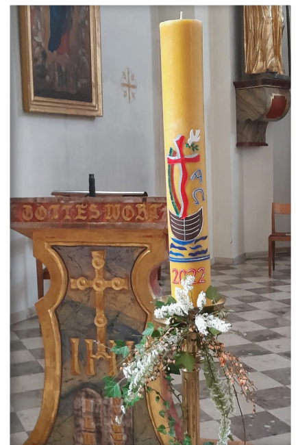
Osterkerze gestaltet von Burgi Glatz