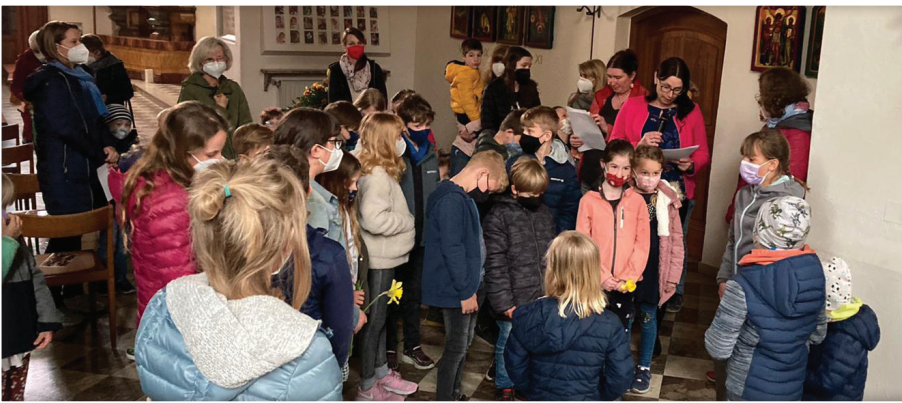
Kinderkreuzweg in der Pfarrkirche Fehring