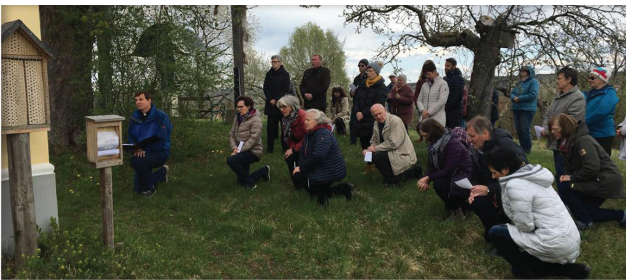
Kreuzwegandacht auf den Kalvarienberg in Höflach